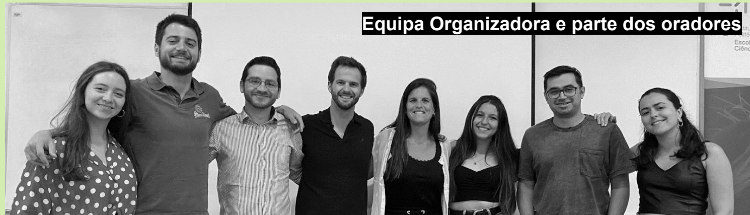
Equipa Organizadora e parte dos oradores