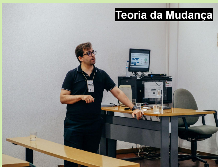
Teoria da Mudança